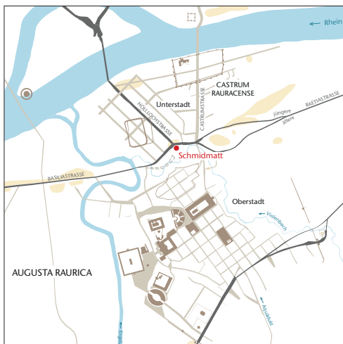
Gesamtplan von Augusta Raurica mit der Lage der Gebäude 1 und 2 der Schmidmatt, dem Fernstrassennetz (grau) und den Gräberfeldern (gelb). Plan Ursula Jansen und Claudia Zipfel

Bauliche Details bezeugen ein Geschoss über den beiden Halbkellern. Im Kontext der besprochenen Räume, die zur Herstellung bzw. Haltbarmachung, Zu- und Vorbereitung von Speisen genutzt wurden, liegt eine Interpretation als Gaststätte und/oder Verkaufsladen auf der Hand. Neben dem Fundmaterial unterstreichen dies auch die erwähnte prägnante Lage des Gebäudes an einer Fernstrasse, die wagentaugliche Zufahrt, die Trennung von Verpflegungs- und Verwaltungsbereich sowie eine Infrastruktur für Wagen bzw. Tiere in der Remise bzw. im Stall und im Hinterhof.