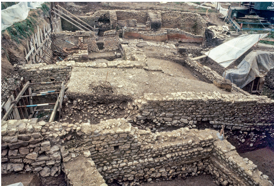
Illustration Tamschick Media + Space GmbH, Berlin (D)

Blick auf die Zufahrtsrampe in den gepflasterten Innenhof von Gebäude 1. Im Hintergrund die sehr gut erhaltenen Mauern und Wandmalereien der Innenräume.