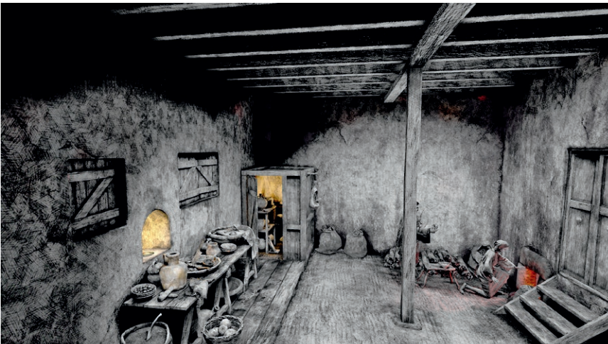
Lebensbild von Raum 2 des Gebäudes 1. Die hier vorbereiteten und gekochten Speisen wurden in der Gaststätte im darüberliegenden Raum zum Verkauf angeboten.

Illustration Tamschick Media + Space GmbH, Berlin (D)