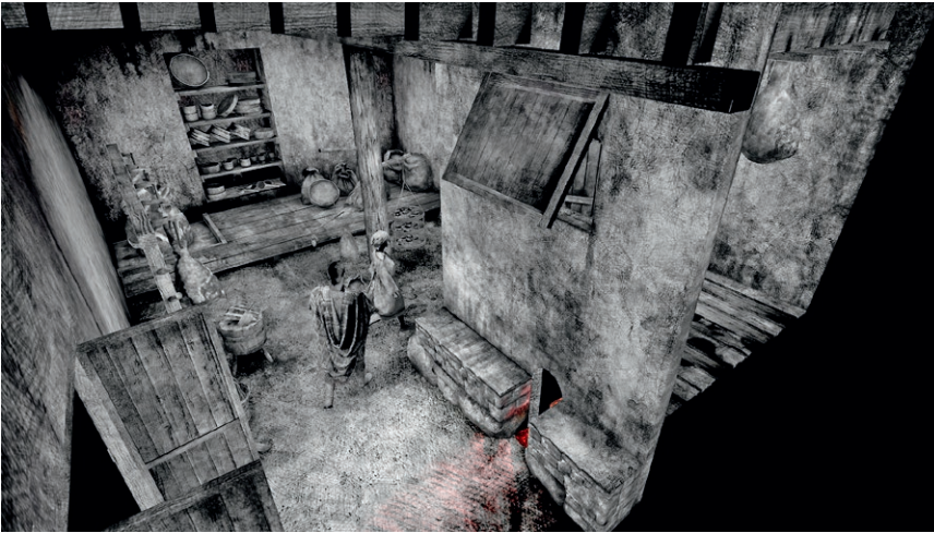
Lebensbild von Raum 1 des Gebäudes 1. Der Raum diente der Lagerung, Haltbarmachung und Verarbeitung von Nahrungsmitteln und/oder Häuten und Fellen.

Illustration Tamschick Media + Space GmbH, Berlin (D)