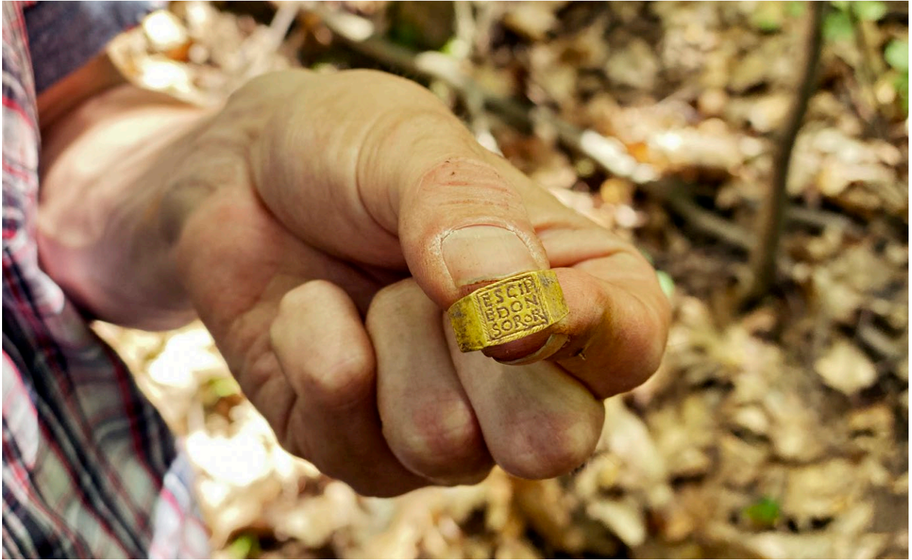
Der glückliche Finder zeigt den perfekt erhaltenen Goldring mit Inschrift.