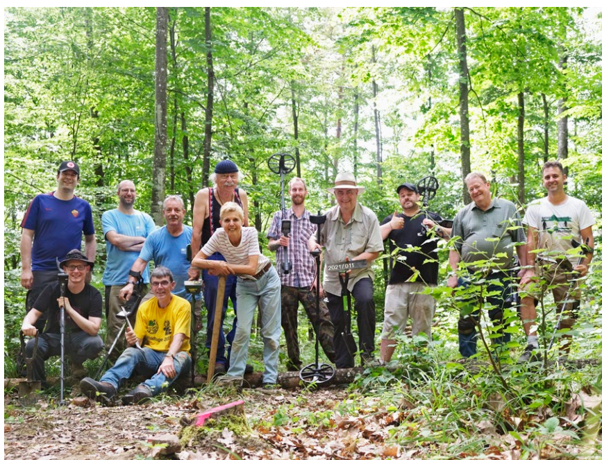
Gruppenfoto der Prospektionskampagne im Juni 2021. Ein grosses Dankeschön an das motivierte Team aus dem Freiwilligenprogramm der Kantonsarchäologie Aargau.

Der Fundort des Rings liegt ausserhalb der Hofmauer im östlichen Vorgelände des Heiligtums. Aus diesem Bereich gibt es bisher keine Hinweise auf zusätzliche Bauten oder andere Strukturen. Der Fundort muss jedoch nicht mit dem ursprünglichen Deponierungsort übereinstimmen. Ob und wie stark der Ring sekundär umgelagert wurde, lässt sich nicht beurteilen.