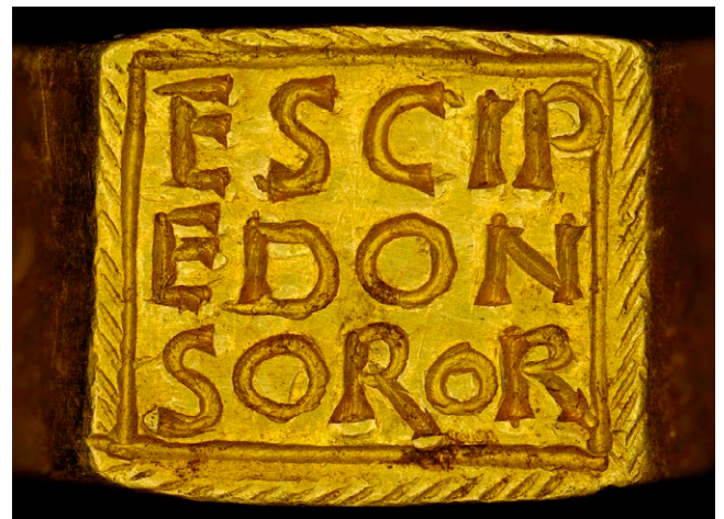
Dieses Mikroskop-Foto zeigt hochauflösend die Details der dreizeiligen Inschrift, die mit kleinen, verschieden kombinierten Punzen angefertigt wurde.

Weshalb der Fingerring seinen Weg auf die Flühweghalde fand, ist unklar. Aufgrund des Materialwerts ist nicht von einem zufälligen Verlust auszugehen. Vielmehr dürfte er bewusst beim Heiligtum deponiert worden sein. Die Besitzerin schenkte den Goldring vermutlich den hier verehrte(n) Gottheit(en) als Opfergabe. Dieses Erinnerungstück verband sie sicher mit schönen Erlebnissen und nahen Menschen. Deshalb ist denkbar, dass sie es im Rahmen eines Übergangsrituals (rite de passage) beim Heiligtum auf der Flühweghalde niedergelegt hat. ■