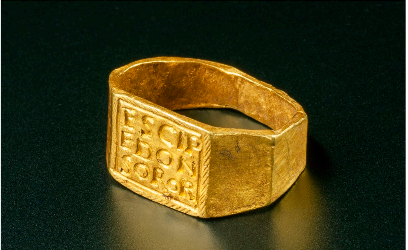
Schrägansicht auf den aussen achteckigen Goldring mit Inschrift. Der achteckige Goldring mit Inschrift weist einen Durchmesser von nur gerade 1,4 cm auf.

musste. Mit einem wertvollen Schmuckstück konnte der Tochter oder einem anderen weiblichen Familienmitglied ein Erbanteil in die Ehe mitgegeben werden, dessen Besitz innerhalb der Stammfamilie gesichert blieb. In diesen Kontext scheint eine Gruppe von auffallend reich ausgestatteten Gräbern von Mädchen und jungen Frauen zu gehören, zu deren «Standardausstattung» (Gold-)Ringe und andere Schmuckobjekte, häufig aus Gold, zählen.