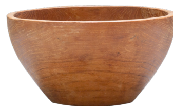
Le scodelle di legno, per esempio, erano usate come stoviglie.