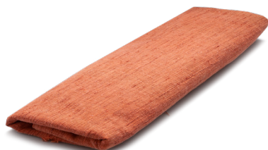
Tessuto per cucire una tunica