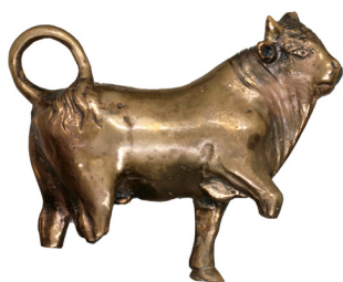
Questa figura di toro in bronzo aveva forse un significato religioso.