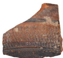
Frammento di un oggetto rotto