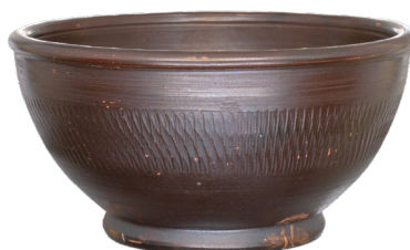
Questa ciotola di ceramica ornata è stata forse usata durante i pasti.