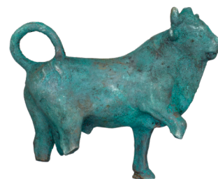
Questo materiale si è fortemente scolorito