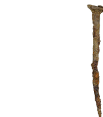
Il materiale è arrugginito e sono diventati fragili.