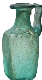
Una brocca di vetro per la conservazione dei liquidi.