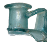
Maniglia e beccuccio di un oggetto rotto