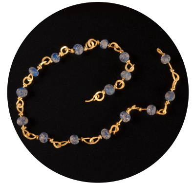
Il braccialetto è stato trovato abbandonato nel cortile