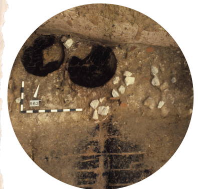
Queste bruciature provengono da botti carbonizzate nel deposito.