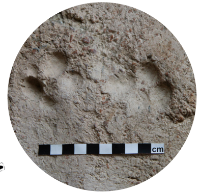
Queste impronte si trovano nel intonacatura delle pareti del deposito.