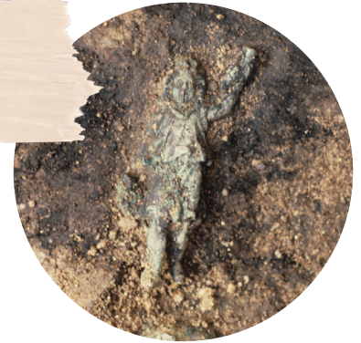
Il Larò giaceva in una scatola sotto il pavimento del soggiorno.