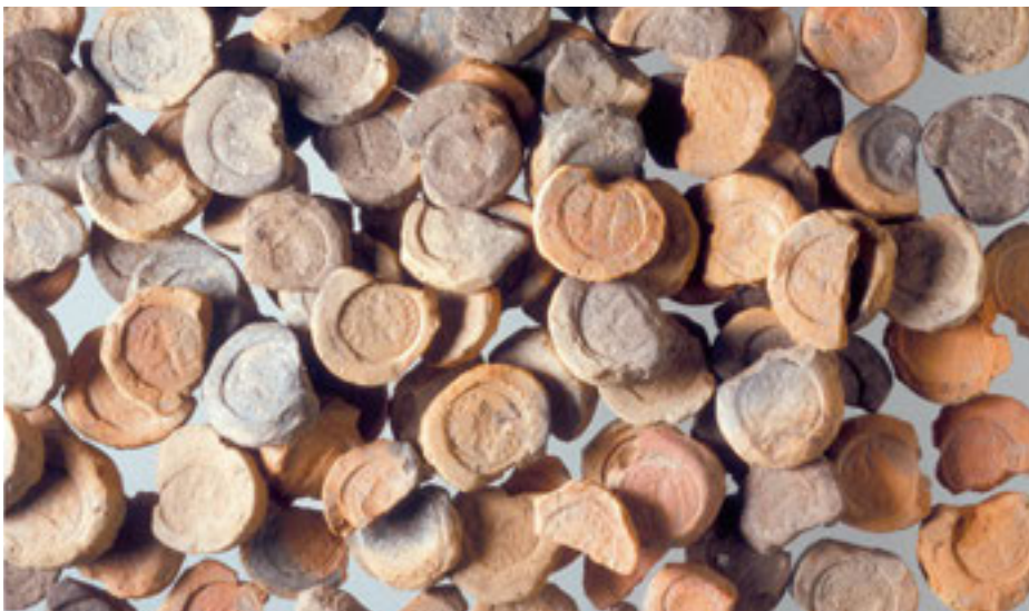
Tonförmchen zum Giessen von Münzen