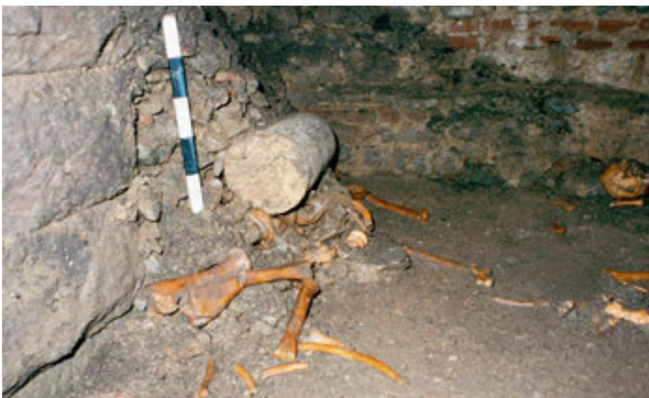
Säulentrommeln und Skelette von Menschen in der Verfüllung des Brunnenhauses

Bautrümmern des benachbarten Bades fanden sich zahlreiche Siedlungsabfälle, viele Knochen von Menschen und Tieren und die Überreste einer Münzgusswerkstatt.