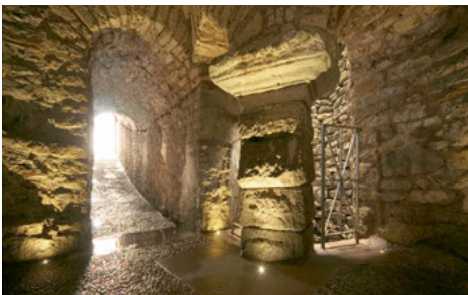
Innenansicht des Brunnenhauses heute

Brunnenhaus und Sodbrunnen waren bei der Auffindung fast vollständig mit Erde verfüllt, die mit vielen, teilweise spektakulären Funden durchsetzt war: Neben